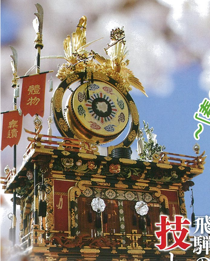
日枝神楽臺【春】 ひえかぐらたい