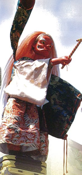
龍神臺【春】 りゅうじんたい