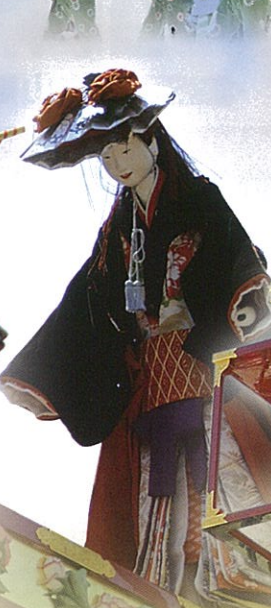
石橋臺【春】 しゃっきょうたい