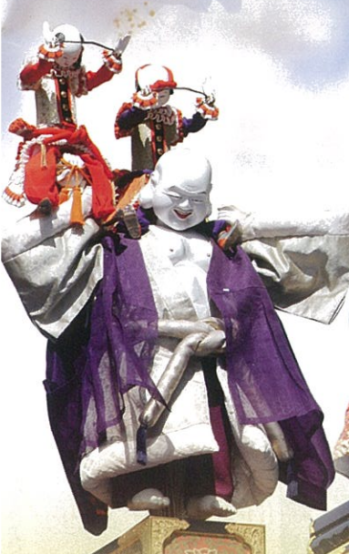
布袋臺【秋】 ほていたい