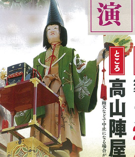
三番叟【春】 さんばそう