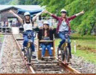
レールマウンテンバイクガッタングー Rail Mountain bike Gattan Go 廃線になったレールの上をマウンテンバイクで走る新感覚の乗り物。※2016年4月9日より営業開始。