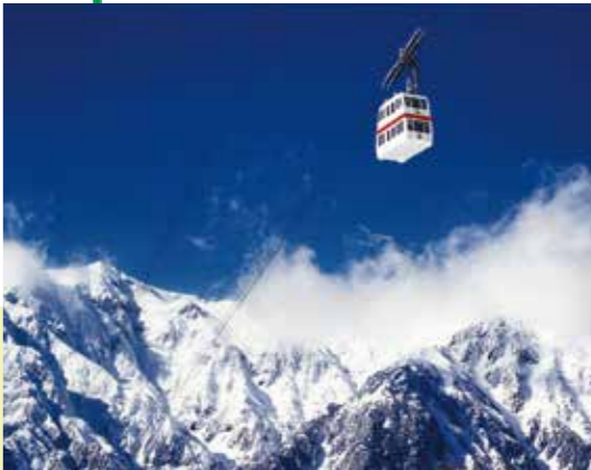
新穂高ロープウェイ Shinhotaka Ropeway 第1・第2ロープウェイを乗り継いで2,156mの雲上の世界へ!! 山頂展望台からは、西穂高岳、槍ヶ岳、笠ヶ岳などの北アルプスが360度の大パノラマでご覧いただけます。