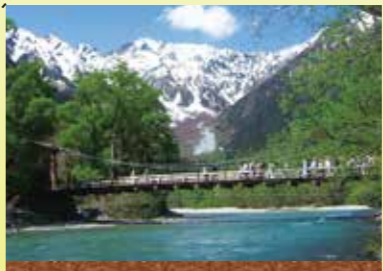
上高地 Kamikochi 北アルプスの雄大な山々と清涼に抱かれた日本屈指の山岳リゾート。幻想的な大正池や清らかな梓川に架かる河津橋は、上高地を代表する景観として知られています。