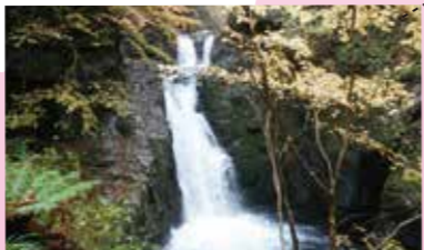
小坂の滝 Osaka of the waterfall 大小さまざまな滝が200以上あり、日本屈指の滝の多さを誇り、「岐阜の宝もの」(第1号)に認定されています。※遊歩道は12月中旬から3月末まで冬季閉鎖。