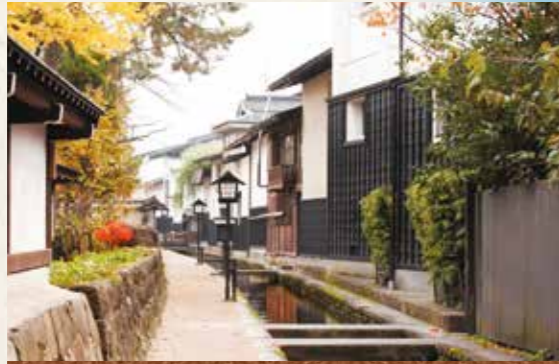
飛騨古川(白壁土蔵) Hida Furukawa 高山の奥座敷と称され、飛騨に残るもう一つの古い町並みとして知られる飛騨古川。瀬戸川沿いに白壁土蔵が立ち並び情緒豊かな景観を醸し出しています。

2015年12月1日運行開始! 富山～白川郷～高山 Toyama～Shirakawa-go～Takayama