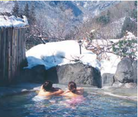
奥飛騨温泉郷 Okuhida Onsen-go 北アルプスの山麓に広がる、平湯・福地・新平湯・橋尾・新穂高の5つの温泉地。とんとんと湧きでる温泉と大自然の景観を楽しみながらの露天風呂は旅の疲れを癒してくれます。