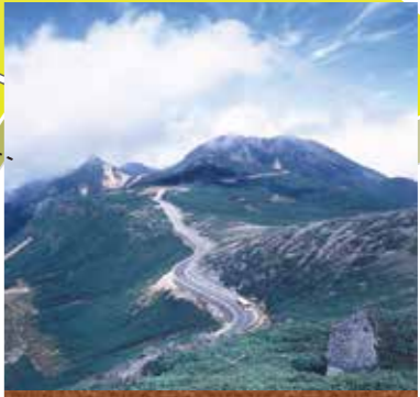
乗鞍スカイライン Mt. Norikura 平湯峠から標高2,702mの乗鞍峠平までを結ぶ全長14.4kmの山岳道路。富士山の五合目よりも高い場所へバスで登ります。