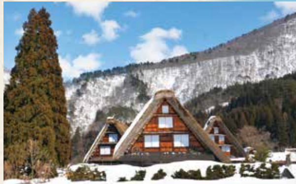
世界遺産白川郷 Shirakawa-go 巨大な茅葺屋根をもつ独特の建築様式の合掌造り家屋が点在し、その昔ながらの原風景は訪れる人の心を魅了します。一年を通して国内外から多くの観光客で賑わう人気のスポットです。