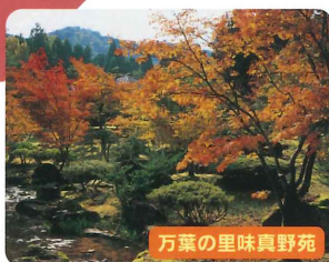
万葉の里味真野苑

JR福井駅東口[9:00発] ⇒ 青木氏庭園 ⇒ 愛山荘(見学・昼食) ⇒ 城福寺庭園(国の名勝) ⇒ 万葉の里味真野苑 ⇒ 越前そばの里(おろしそばの試食&お買い物) ⇒ JR福井駅東口[16:10頃着]