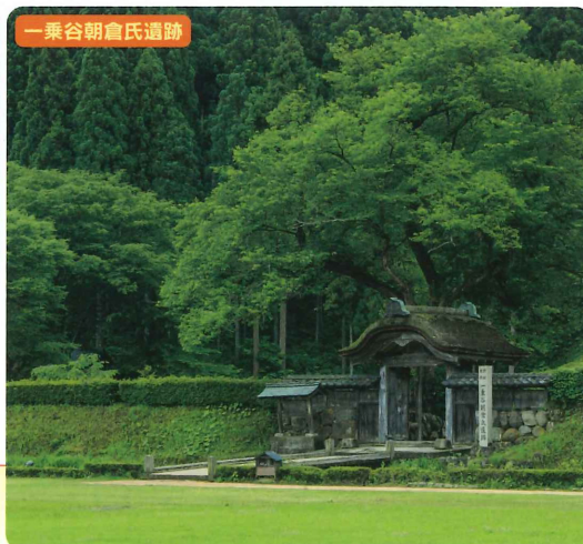
一乗谷朝倉氏遺跡