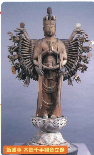
飯盛寺 木造千手観音立像

JR福井駅東口[8:30発] ⇒ JR敦賀駅 ⇒ 飯盛寺(木造千手観音立像) ⇒ 谷田寺(木造千手観音立像) ⇒ 昼食(若杉末広亭) ⇒ 萬徳寺(木造阿彌陀如来坐像) ⇒ 加茂神社(木造千手観音立像) ⇒ 諦応寺(木造薬師如来立像) ⇒ JR敦賀駅 ⇒ JR福井駅東口[17:50頃着]