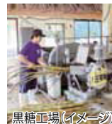
黒糖工場(イメージ)