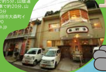
湯津温泉 湯津温泉

世界遺産石見銀山遺跡に湧く開湯約1300年の古湯 ●日本の温泉町で唯一「重要伝統的建造物群保存地区」に指定されており、レトロな町並みに情緒を感じます。源泉が2箇所あり、湯治場として評判が高い由緒ある温泉で、江戸時代には北前船の寄港地としても栄えました。