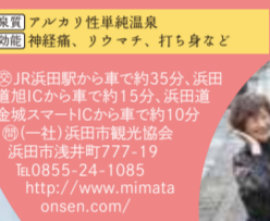
美又温泉 開湯150周年を迎えた美又温泉。身体にまとわりつき、まるで化粧水のような肌触りの泉質は、温度47℃の無色透明アルカリ性単純温泉で、「美人の湯・美肌の湯」として親しまれています。

●美肌の湯! スルツルの後はスベスベ肌に! 開湯150周年を迎えた美又温泉。身体にまとわりつき、まるで化粧水のような肌触りの泉質は、温度47℃の無色透明アルカリ性単純温泉で、「美人の湯・美肌の湯」として親しまれています。