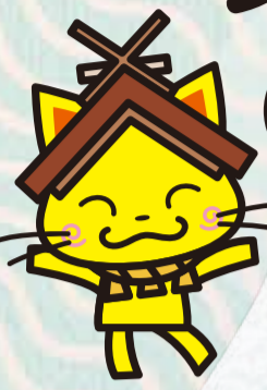
島根県観光キャラクター しまねっこ

島根県西部・石見地方には さまざまな種類の温泉があります。 1300年の歴史がある 古湯や美肌の湯、山峡の秘湯など、 心ゆくまでお楽しみ下さい。