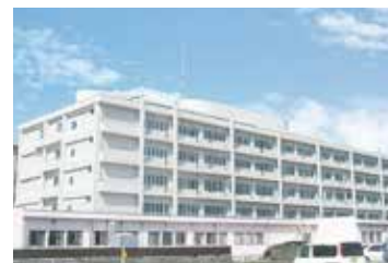
国立病院機構都城医療センター (旧 国立病院機構都城病院)

※救急医療機関は急病時のためのもので、一般診療所ではありません。可能な限り一般診療所を受診してください。 ※都城市では24時間の救急医療体制が整備されています。