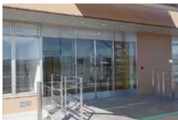
都城夜間急病センター (旧 都城救急医療センター)