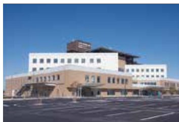
都城市医師会病院