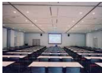
茶霧茶霧ギャラリー