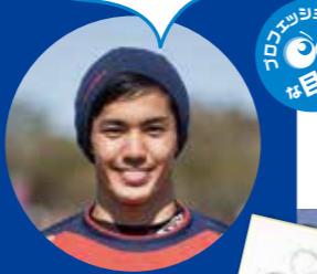
FC東京 武藤 嘉紀選手

澄んだ空気の中、最高の芝生で練習が出来て気持ちも入ります。また、同施設内にはジムもあり素晴らしい環境です。