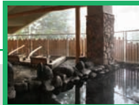
旭岳温泉 大雪山の百鬼にある温泉で、宿によっては部屋の窓から旭岳の美しい景色を楽しむことができます。