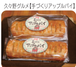
久々野グルメ【手づくりアップルパイ】