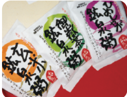
小坂グルメ【鉱泉粥】