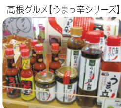
高根グルメ【うまっ辛シリーズ】

クーポン参加店でのお土産購入や日帰り温泉入浴料など、1,000円のお買い上げごとに500円を割引いたします。