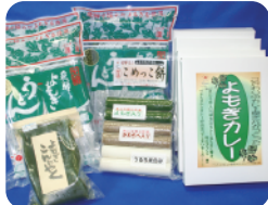
朝日グルメ【よもぎシリーズ】