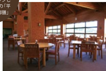
高い天井で開放的な店内。スローな時間が流れる。ここでは、本州最北の地・夏泊岬の先端

宿泊できる海浜ロッジもある夏泊ゴルフリンクス。そのクラブハウスにあるレストラン。三上料理長は、青森県認定「青森県の食の達人」でもあり、達人の技を中華で堪能することができる。レストランだけの利用も可。