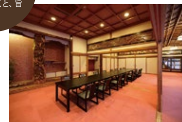
創業45年の歴史を感じる店内

通常は地元の宴会や法事のお客さんのみの老舗店が、今回特別に「平内ホタテ活御膳」のメニューを実施。つまり、観光客は普段は利用することがないだけに、この機会にぜひとも訪れてみたい。※利用の2日前までに要予約。