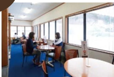
大きな窓で明るいイートインコーナー

平内産ホタテや陸奥湾で獲れる魚介類、土産品等を館内の1階で販売。「平内ホタテ活御膳」も1回のイートインコーナーで。ソフトクリーム のホタテ味はぜひとも食べてみたい逸品!! 2階では平内町の歴史を展示。